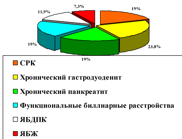
Рис. 1 Распределение пациентов по нозологиям

Н евротические расстройства и психосоматические заболевания в настоящее время являются одной из ведущих медикосоциальных проблем. Распространенность их в популяции чрезвычайно высока – 10-20% всего населения в развитых странах, причем средний ежегодный показатель прироста их распространенности в мире превышает 10% [2,4]. Поэтому проблема эффективной диагностики и лечения невротических расстройств и психосоматических заболеваний выходит сегодня на одно из первых мест в медицине и фармакологии. По современным данным 20-40% больных, обращающихся к врачам общей практики, имеют разной степени выраженности депрессивные расстройства. В настоящее время депрессия становится болезнью века. По мировым прогнозам на последующие одно-два десятилетия количество депрессий в мире достигнет такого уровня, что в общей структуре заболеваний они будут занимать второе место. Общемедицинская значимость этой проблемы определяется не только широкой распространенностью депрессивных расстройств в общей популяции, но и тенденцией к затяжному течению и хронизации, повышенным суицидальным риском [2,4,6].