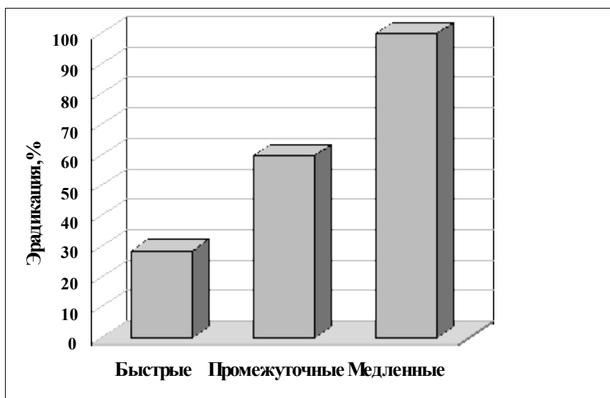
Рис. 2: Метаболизм CYP2C19: Эрадикация Helicobacter pylori: медленные - эрадикация 100%; промежуточные - 60%; быстрые - 28,6%.