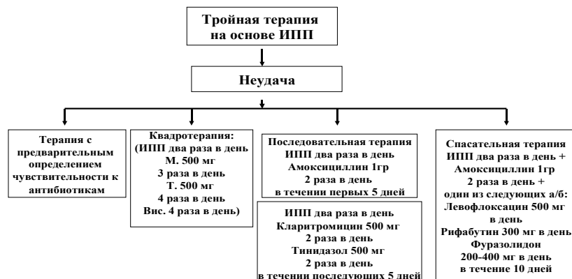
Рис. 3: Алгоритм действия при неэффективности терапии первого ряда.